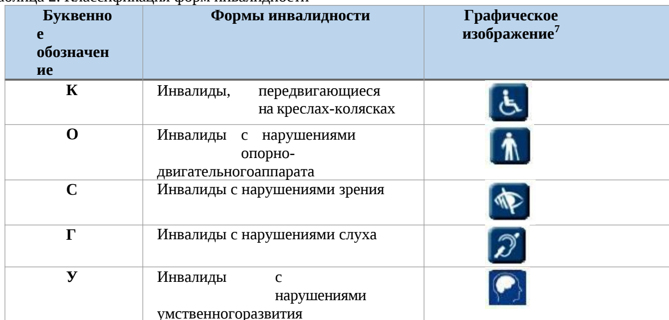
Таблица 2. Классификация форм инвалидности

Для решения вопросов создания доступной среды жизнедеятельности на объектах социальной инфраструктуры разработана классификация форм инвалидности.